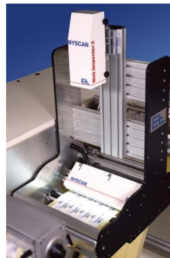
Abbildung 2: Druckkontrollsystem mit gerichtetem Licht auf Umroller.

Um den Anforderungen gerecht zu werden, kommen prinzipiell zwei Beleuchtungsprinzipien zur Anwendung. Das erste Prinzip arbeitet mit einer gerichteten Lichtquelle, was bedeutet, daß die Bahn aus