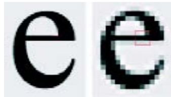
Abbildung 3: Vergrößerung links bei 6000 Pixel Auflösung, rechts bei 2000 Pixel Auflösung.

Entscheidend für die Wahl eines Kontrollsystems ist natürlich die Frage nach der minimalen Fehlergröße, die vom System zuverlässig