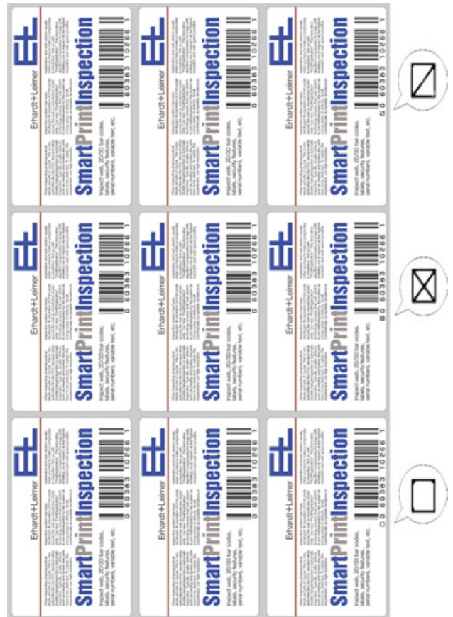
Abbildung 4: Validierungsmerkmale auf dem Report.

erkannt werden kann. Farbabweichungen treten meist großflächig auf, weshalb in den folgenden Ausführungen auf diese Fehlerart bei der Klärung dieser Frage nicht eingegangen wird. Somit werden lediglich Fehler betrachtet, welche sich aus fehlendem oder zusätzlichem Auftrag ergeben. Oft wird die kleinste detektierbare Fehlergröße der Größe eines Kamerapixels gleichgesetzt. Dies ist bei der Kontrolle von homogenen Oberflächen oder auch von homogenen Hintergrundbereichen statthaft. Befinden sich kleinste Fehler nahe oder sogar in veränderlichen Bereichen wie zum Beispiel Buchstaben, so ist diese Definition nicht mehr haltbar. Eine leichte Verdickung des Buchstabens ist sicherlich in den meisten Fällen akzeptabel und sollte nicht zu einer Fehlermeldung führen. Auch kleine Registerschwankungen oder Verzerrungen, welche durch Veränderungen der Bahnspannung oder bei flexiblen Folien auftreten, müssen vom Kontrollsystem zugelassen werden. Obwohl moderne Kontrollsysteme solche Effekte durch adaptive Kontroll-Algorithmen kompensieren, stehen die Qualität des Drucks und die Genauigkeit der Kontrolle in engem Zusammenhang. Aus diesen Überlegungen folgt, daß sich der kleinste detektierbare Fehler immer über eine gewisse Anzahl von als fehlerhaft detektierten Pixeln ergibt, wel-